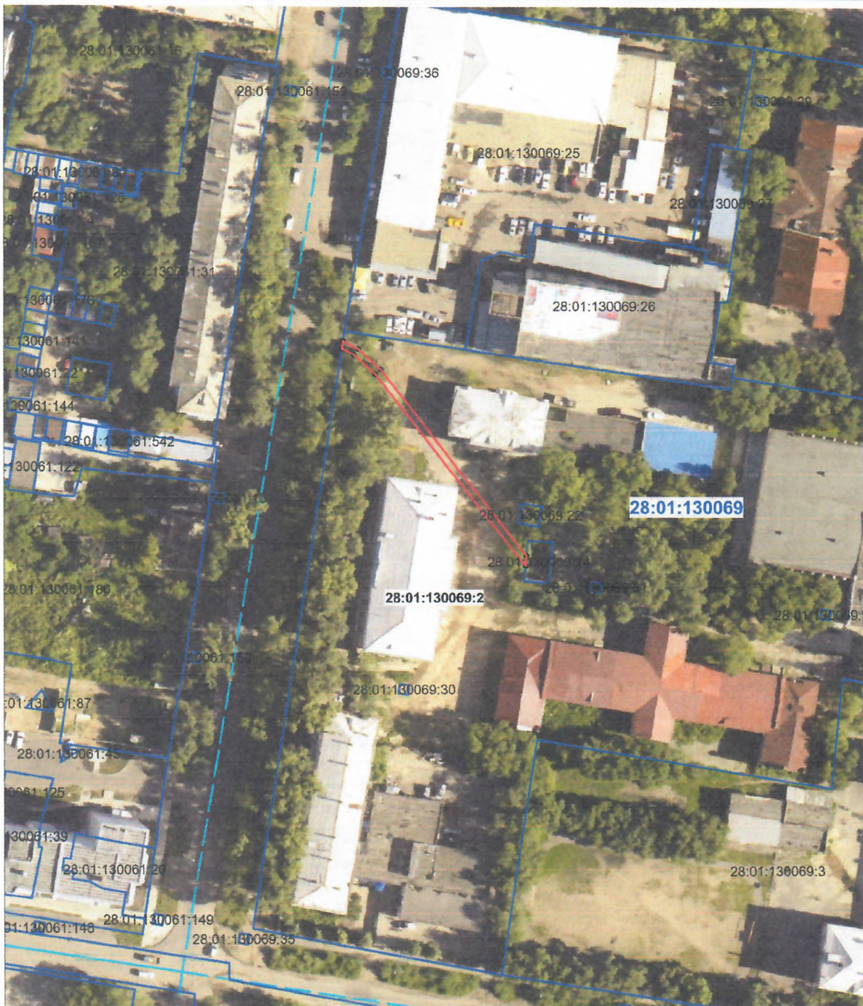
Схема расположения публичного сервитута